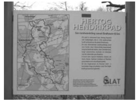
Infobord Hertog Hendrikpad