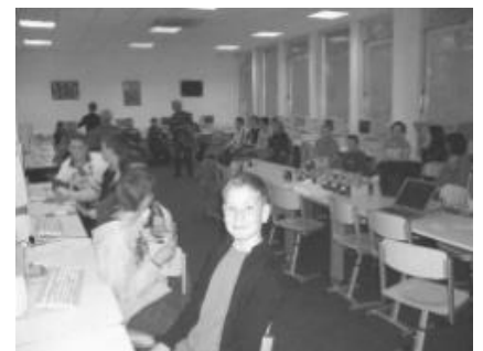
Introductieles GPS op Fioretti College